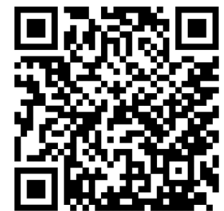
QR-Code - Sirenen-Töne im Internet

Sie können die Sirenen im Internet anhören.